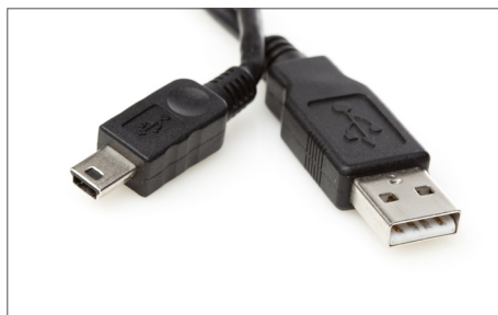
Safescan USB cable de actualización Art. no: 112-0459