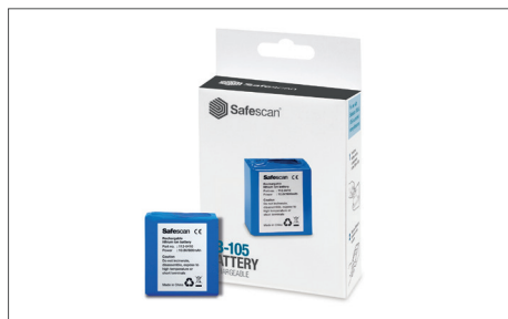
Safescan LB-105 Batteria ricaricabile Art. no: 112-0410