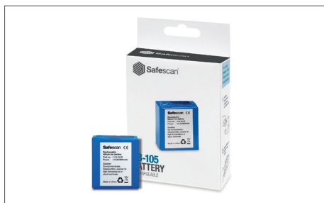
Safescan LB-105 Batteria ricaricabile Art. no: 112-0410