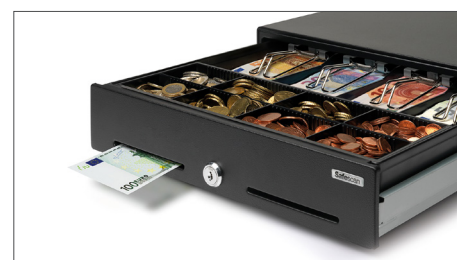
Fessura di separazione per il deposito di banconote di grande taglio e valori