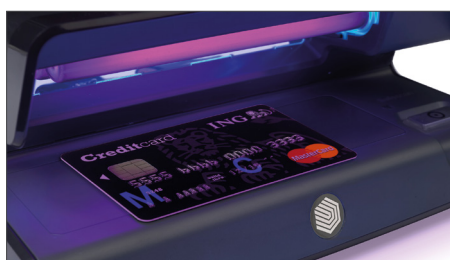
Verifica le caratteristiche UV delle carte di credito