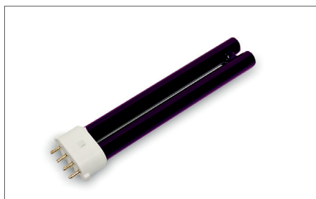
Safescan UV 50 / 70 Lampade UV