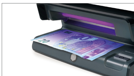
Verifica le caratteristiche UV delle banconote